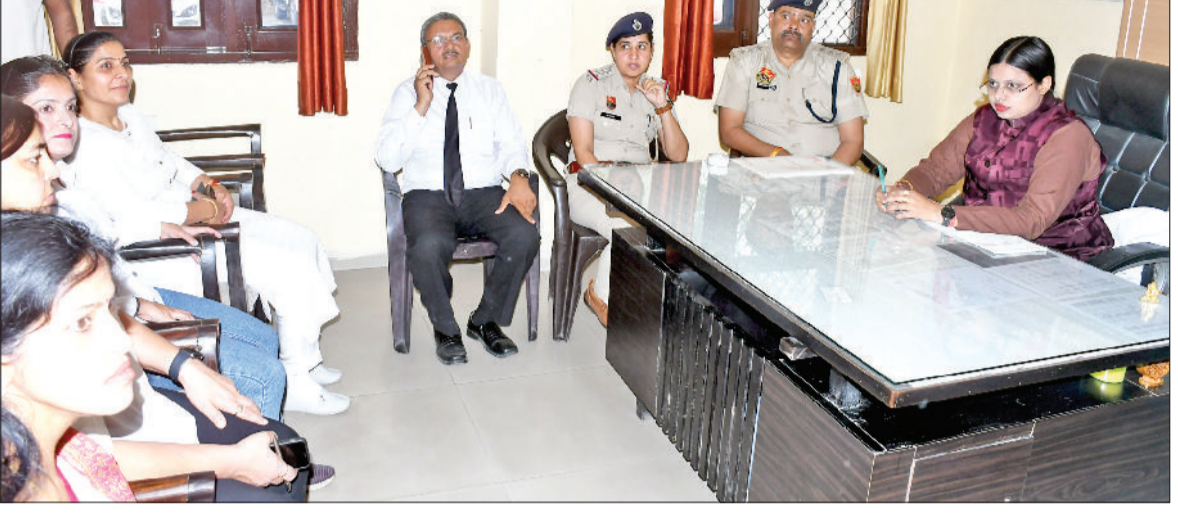
रोहतक। महिला थाने में अधिकारियों से जानकारी लेते हुए महिला आयोग की वाइस चेयरमैन सोनिया अग्रवाल।

महिला आयोग महिलाओं की सुरक्षा के लिए हमेशा तत्पर है। महिलाओं को उनके अधिकारों से अवगत करवाने के लिए कानूनी जागरूकता शिविर लगाए जा रहे हैं। यह बात बृहस्पतिवार को हरियाणा राज्य महिला आयोग की उपाध्यक्ष सोनिया अग्रवाल ने महिला पुलिस थाना तथा गांधी कैंप के महिला आश्रम स्थित वन स्टॉप सेंटर सखी का निरीक्षण के दौरान कही। उन्होंने अधिकारियों को महिलाओं की सुरक्षा के दृष्टिगत आवश्यक दिशानिर्देश भी दिए। इसके उपरांत उन्होंने पुलिस अधीक्षक हिमांशु गर्ग से महिलाओं के विरुद्ध अपराधों पर चर्चा के दौरान कहा कि शहरी क्षेत्र की छोटी बस्तियों में महिलाओं को उनके अधिकारों के प्रति जागरूक करने के लिए कानूनी जागरूकता शिविर लगाए। आयोग की उपाध्यक्ष ने सर्वप्रथम महिला पुलिस थाना पहुंचकर वर्तमान वर्ष के दौरान